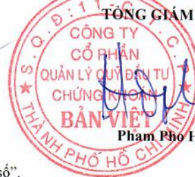
Phạm Phó Hop

Ghi chú: Những chỉ tiêu không có số liệu có thể không phải trình bày nhưng không được đánh lại "Mã số".